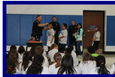
Ceremonia de Graduación de Too Good for Drugs

Al traer a sus hijos en la mañana, por favor salgan del carril lo antes posible luego de bajar a sus hijos. Contamos con personal escolar que se encarga de ver que todos entren en sus salones. Si su hijo olvida algo en el coche, le pedimos atentamente se estacione en el estacionamiento y usted traiga el objeto a la oficina. Muchas gracias por su cooperación.